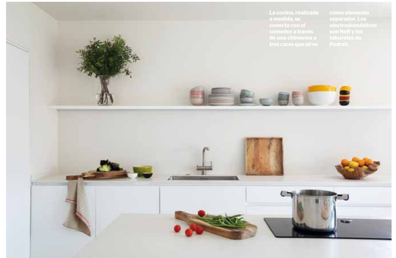
La cocina, realizada a medida, se conecta con el comedor a través de una chimenea a tres caras que sirve como elemento separador. Los electrodomésticos son Neff y los taburetes de Pedrali.