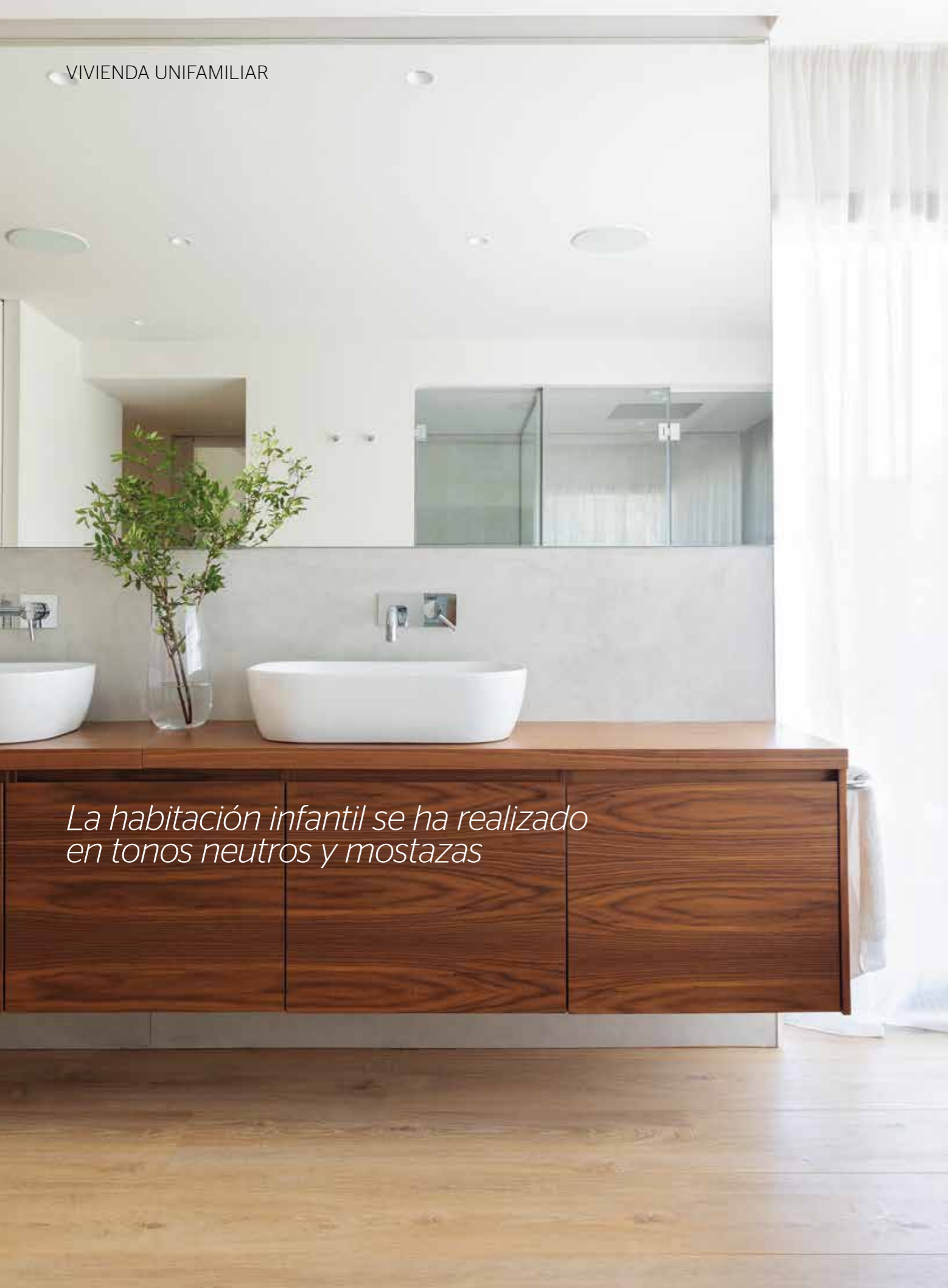
La habitación infantil se ha realizado en tonos neutros y mostazas