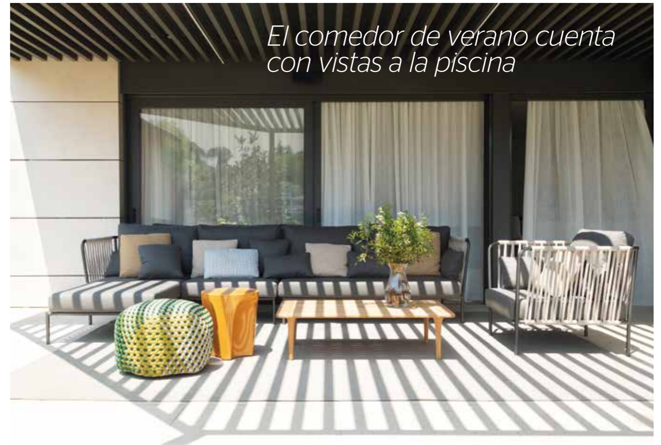
El comedor de verano cuenta con vistas a la piscina