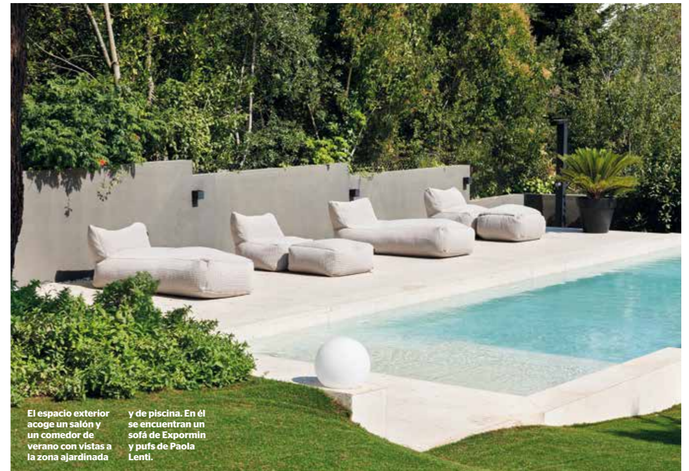
El espacio exterior acoge un salón y un comedor de verano con vistas a la zona ajardinada