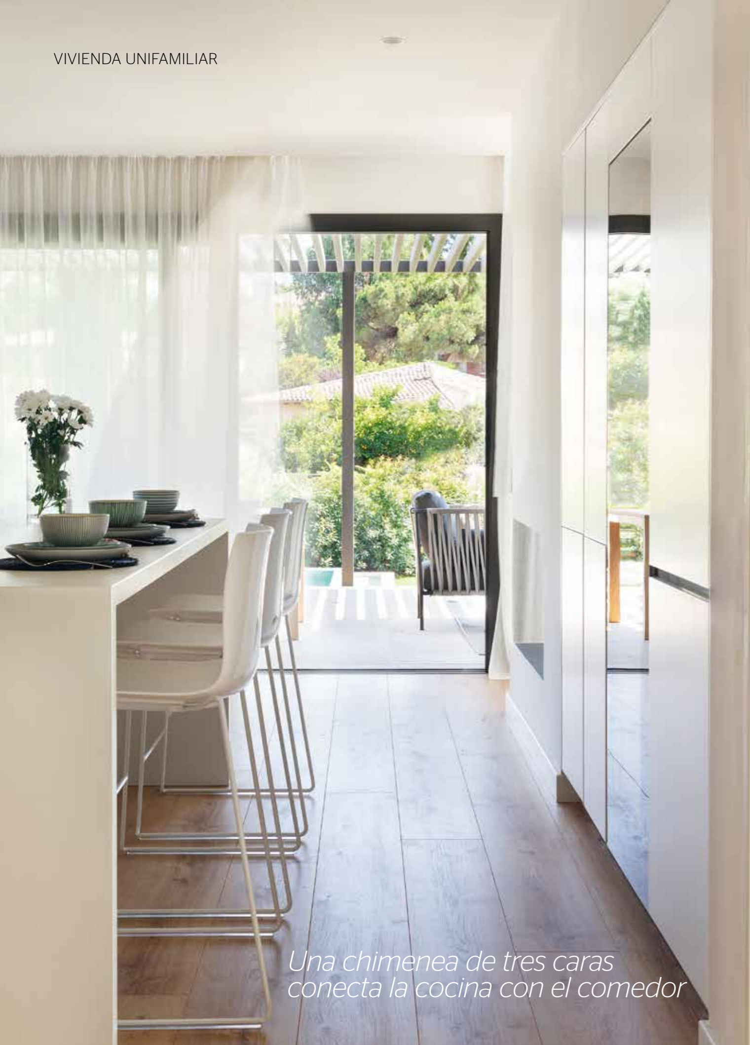
Una chimenea de tres caras conecta la cocina con el comedor