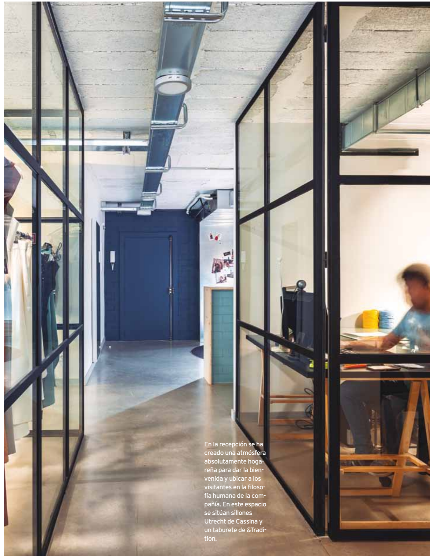
En la recepción se ha creado una atmósfera absolutamente hogareña para dar la bienvenida y ubicar a los visitantes en la filosofía humana de la compañía. En este espacio se sitúan sillones Utrecht de Cassina y un taburete de &Tradition.